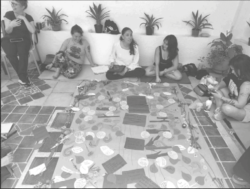
INICIO DEL ÁRBOL DE LA MEMORIA