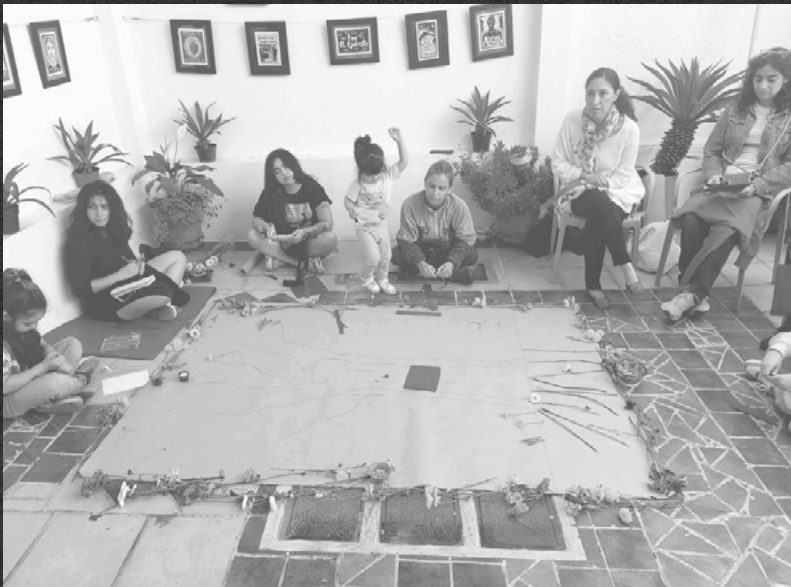
CIERRE DEL ÁRBOL DE LA MEMORIA VIVA