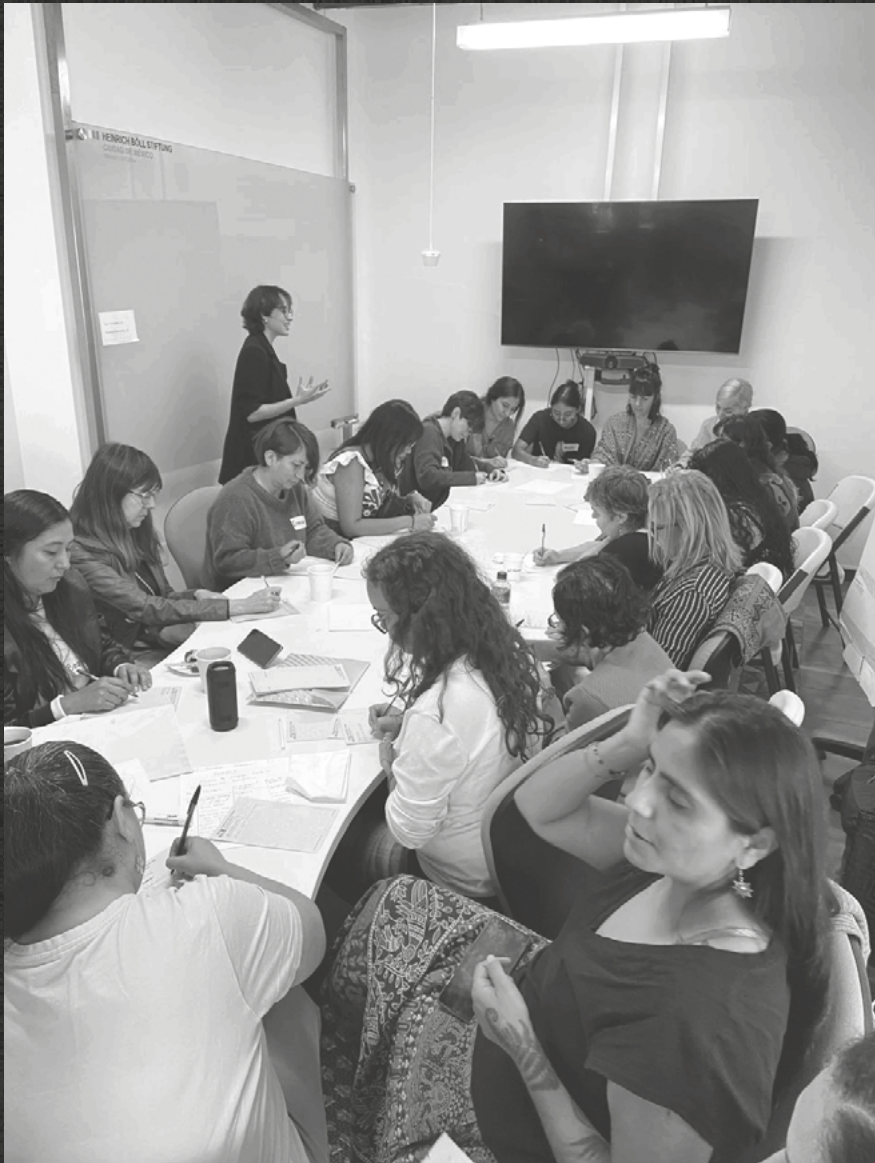
MICRO RELATOS Y CADÁVERES EXQUISITOS