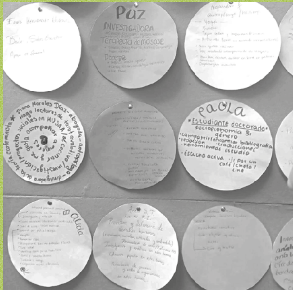
EJERCICIO LO QUE OFREZCO