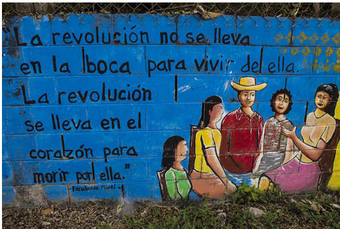
Mural de San Antonio Los Ranchos.

En San Antonio los Ranchos , un municipio del departamento de Chalatenango, con historia de guerra, donde el FMLN logró construir una base social muy sólida, que le ha permitido ganar la municipalidad durante los 21 años de elecciones en la posguerra, sufrió ahora una derrota, por decisión expresa y anticipada de la población, que es parte de la militancia del partido y que por ello se siente con el derecho de elegir a sus candidatos. En este municipio, la dirección política del FMLN hizo caso omiso de la opinión de la población de no reelegir al Alcalde actual, por lo que la población buscó al otro partido de izquierda, Cambio Democrático, para llevar a su propio candidato y de esa manera garantizó el gane.