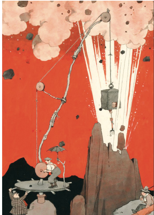
HEATH ROBINSON / A machine to collect lost golf balls

¿Qué habría pasado si se tratase del Acuerdo que supuestamente gobernaría a la geoingeniería y hubiese ya actividades en proceso de realización?