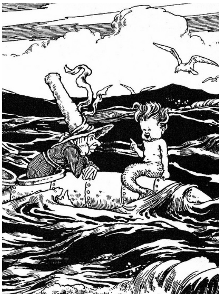
HEATH ROBINSON / The adventures of Uncle Lubin

Esto conlleva al problema de que puesto que ninguna de las técnicas busca enfrentar las causas del cambio climático, la geoingeniería funcionaría como excusa que desvía la atención y las voluntades políticas de las soluciones reales. La geoingeniería solo se propone contrarrestar parcialmente, algunos síntomas del problema del cambio climático, mientras que sus causas (como el creciente consumo de energía, la urbanización descontrolada, la agricultura insustentable y los cambios de uso de suelo), seguirán actuando, causando una mayor catástrofe climática, con lo que se crea además un “mercado cautivo” para las técnicas de geoingeniería.